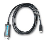
VE.Direct to USB interface