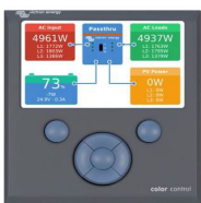
Color Control GX